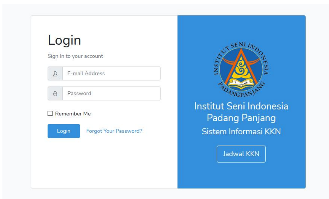
Tampilan halaman login sistem informasi kkn

Apabila sebelumnya telah melakukan pendaftaran, maka mahasiswa bisa langsung menuju ke halaman login dengan mengklik tombol Login Sekarang atau Login.