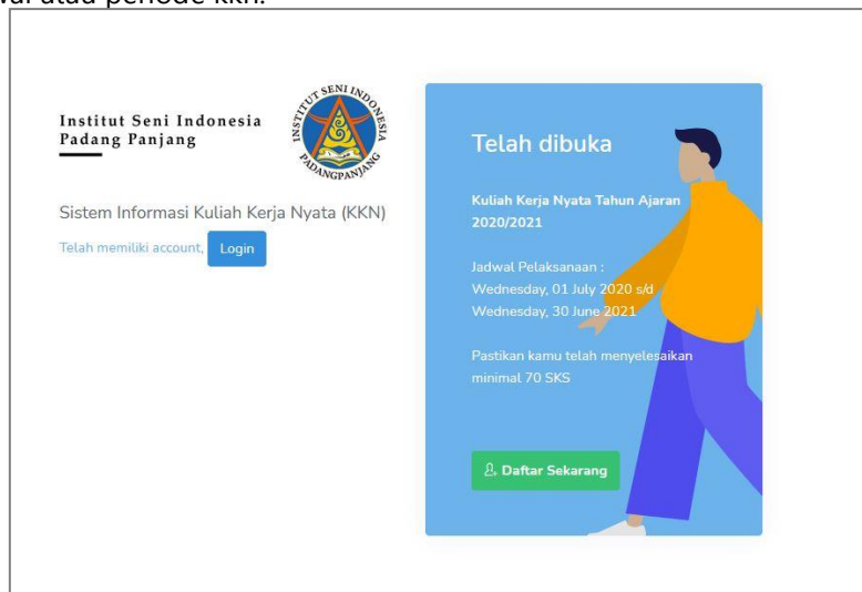
Tampilan home dan terdapat jadwal atau periode kkn yang aktif atau dibuka untuk pendaftaran.

Halaman home adalah halaman yang pertama kali tampil ketika mengakses sistem informasi kkn. Halaman ini akan menampilkan jadwal atau periode kkn yang sedang dibuka untuk pendaftaran. Mahasiswa dapat melakukan pendaftaran kkn apabila pada halaman ini terdapat jadwal atau periode kkn.