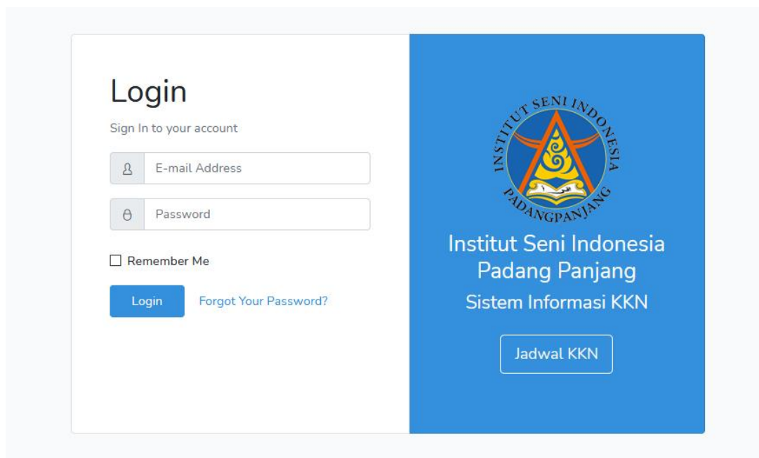
Tampilan halaman login sistem informasi kkn

Apabila sebelumnya telah melakukan pendaftaran, maka mahasiswa bisa langsung menuju ke halaman login dengan mengklik tombol Login Sekarang atau Login.