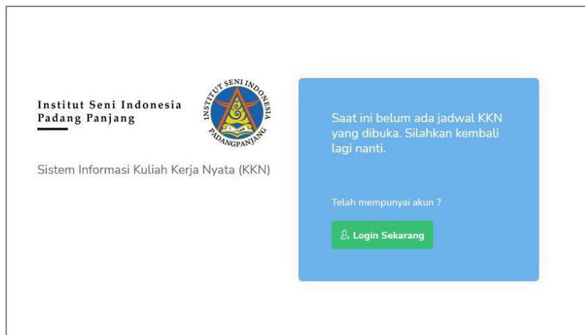
Tampilan home dan tidak ada jadwal atau periode kkn yang sedang dibuka

Mahasiswa yang belum melakukan pendaftaran dapat mengklik tombol 'Daftar Sekarang' pada kotak jadwal atau periode kkn yang ingin diambil. Setelah itu isi form pendaftaran dan mahasiswa bisa langsung login ke sistem informasi kkn untuk melihat status pendaftaran kkn tersebut.